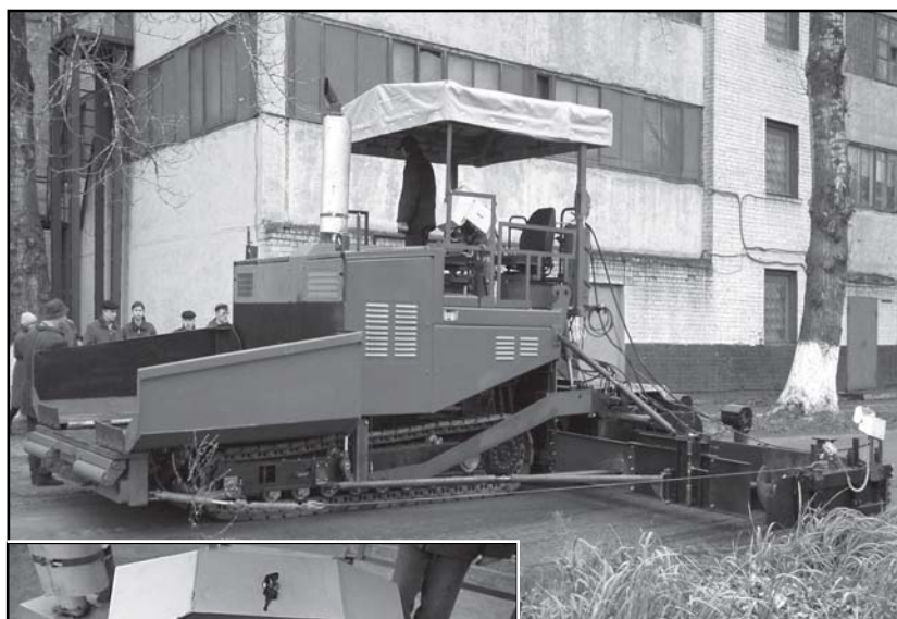
Рис. 1. Общий вид асфальтоукладчика

В.И. ЮДИН (главный конструктор ОАО «Ирмаш»)