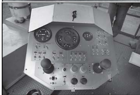
Рис. 2. Пульт управления асфальтоукладчиком